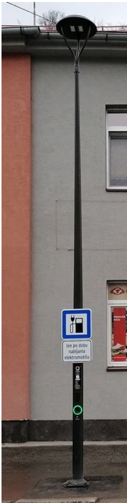
Nabíjačka integrovaná do stĺpa verejného osvetlenia