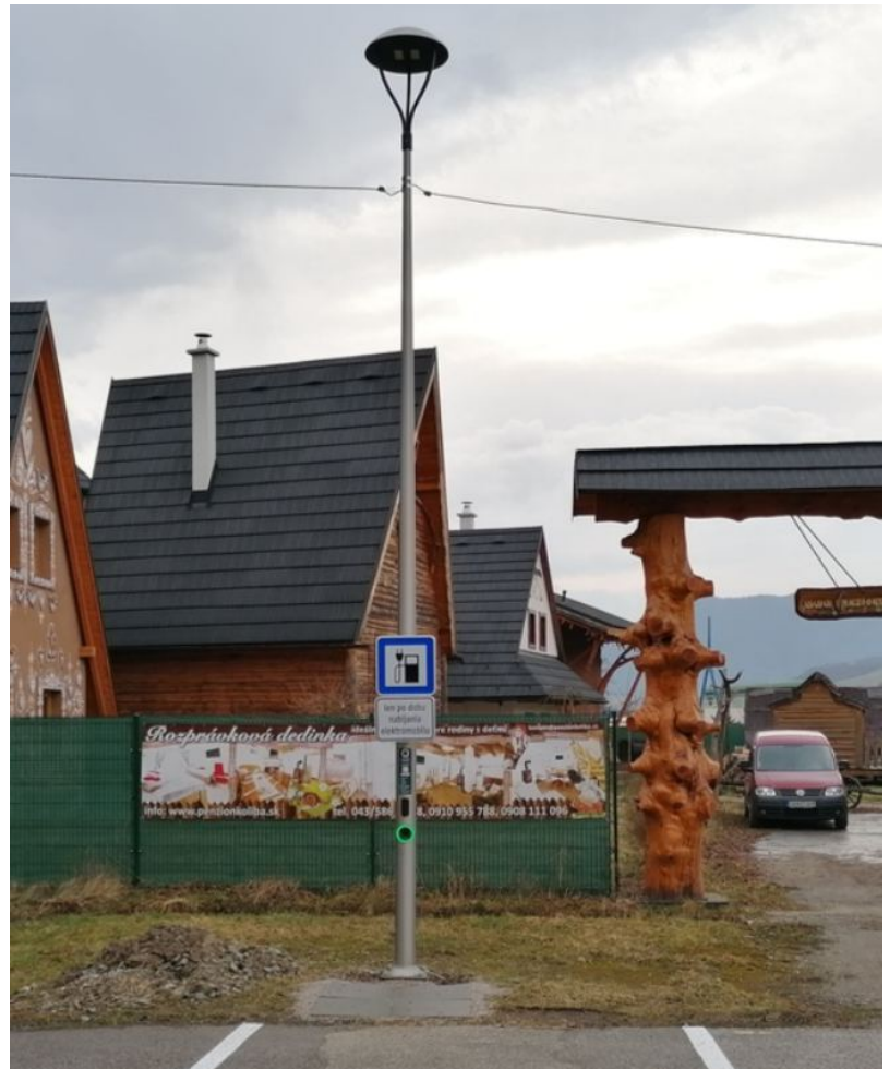
Nabíjačka pri reštaurácii Koliba